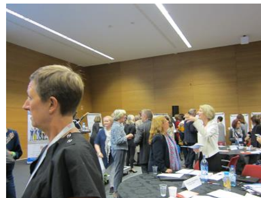
集計を待つひととき