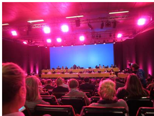
治療方針についての議論と投票 壇上に各国のエキスパートが。