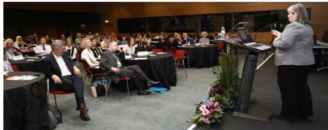
ABC Global Alliance 1 st meeting 11/4-5, Lisbon